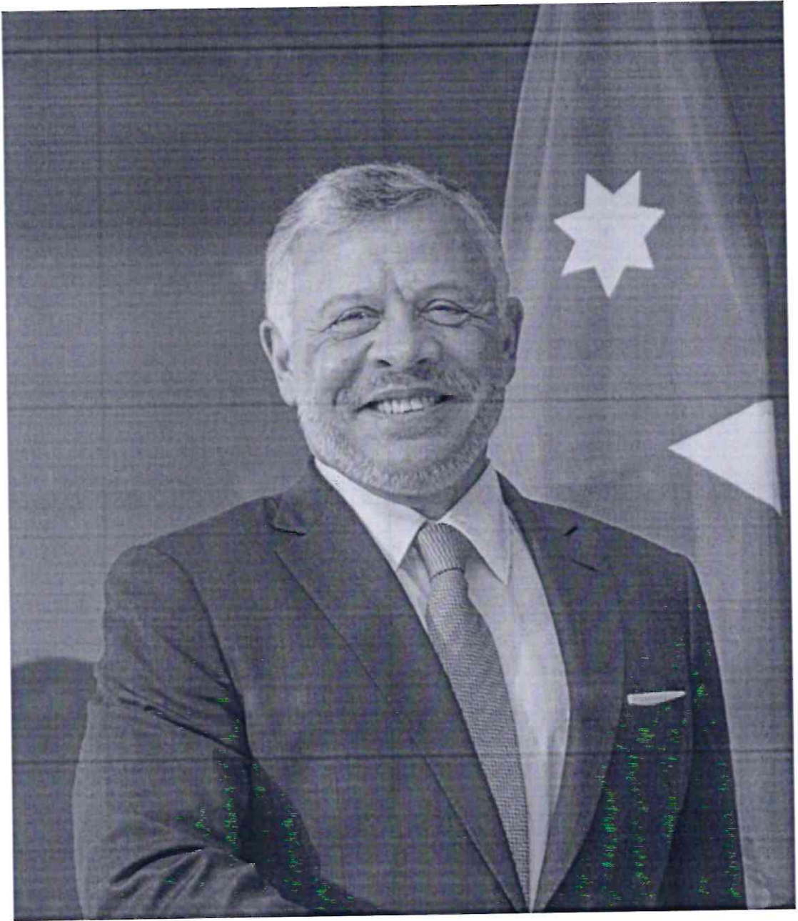
حضرة صاحب الجلالة الملك عبد الله الثاني ابن الحسين المعظم