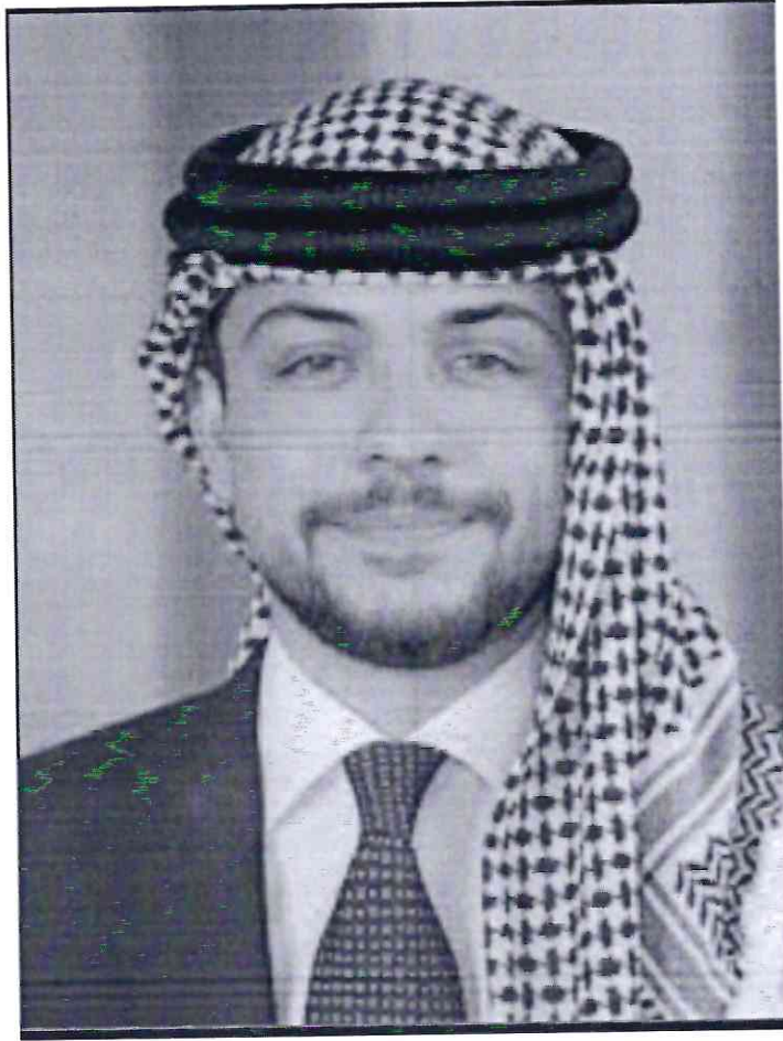
حضرة صاحب السمو الملكي الحسين بن عبد الله الثاني ولي العهد